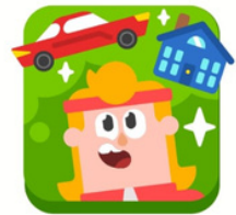
Doctor Eddy +14 XP