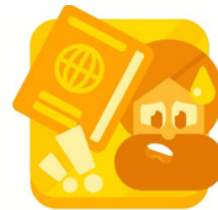
The Passport +14 XP

Ιδιαίτερα χρήσιμη είναι η ενότητα κατανόησης διαφόρων γλωσσών. Προσπαθήστε να αναπτύξετε ένα μάθημα με βάση την κατανόηση ενός ήχου στο duolingo.